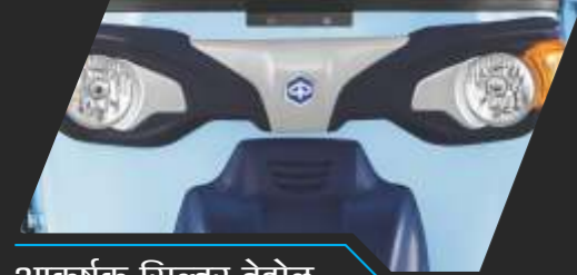
आकर्षक सिल्वर बेझेल