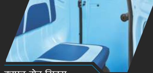
ड्यूरल टोन सिटस